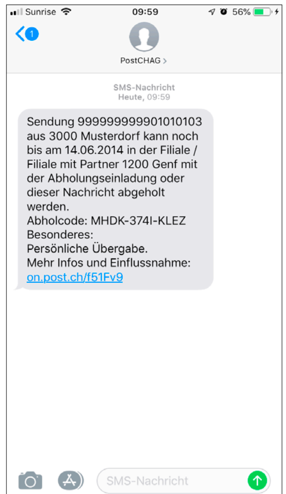
Statusmeldung per SMS, Bsp. «Erinnerung an Empfänger»