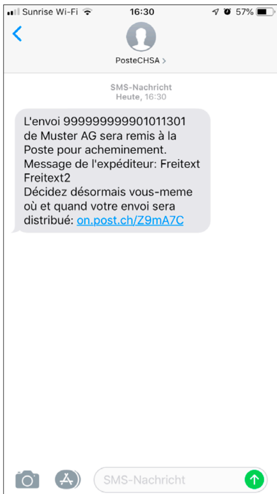
Avis de statut par SMS, ex. «Attestation de dépôt» avec texte libre